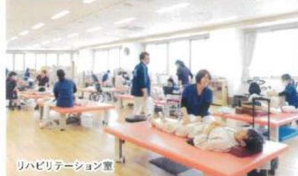
リハビリテーション室