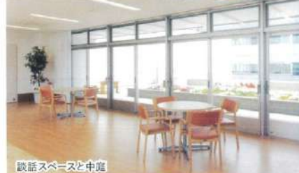
談話スペースと中庭