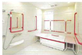
●ユーザー可変型個浴