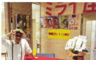
●ミライ座 映画鑑賞