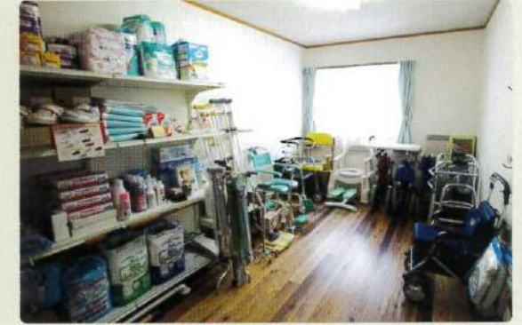
介護ショップひまわりショールーム

ご本人様、ご家族様の気持ちを第一に考え、迅速な対応とその方にあったケアプランをご提案致します。