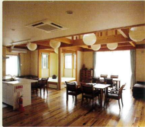
リビング/共有スペース

住み慣れた地域で、「通い」を中心に「訪問」と「泊まり」を組み合わせたサービスを24時間365日提供します。