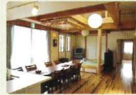
リビング/共有スペース

小規模と同じ雰囲気作りを重視し、少人数かつ、家庭的な環境でみなさん自身が安心して過ごせる場所と暮らしを支える支援をめざします。