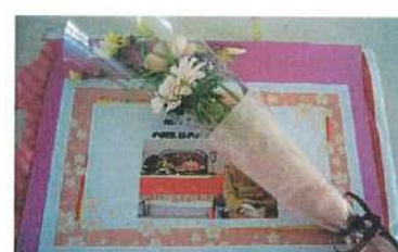
お誕生会（お花とカード）