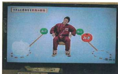
ごぼう先生のレク体操

デイサービス福聚ではエアロバイク、滑車、車いすの方もできる自転車こぎ、平行棒にて昇降歩行や立ち上がり訓練を行い筋力の維持向上を支援しております。日々日常の生活リハビリで自然と体力もついてきます。