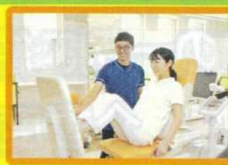
この器具で 筋力を測定

10年以上継続して週4回の頻度でご利用いただいている方です。 新しい器具が入った令和3年4月の下肢筋力が87kgでした。その後も運動を継続し、徐々に筋力が向上し現在は100kgとなっています。 。筋力向上に年齢は関係ありません！年齢のせいと諦めず、ぜひ一度MIRAのご利用をご検討ください。