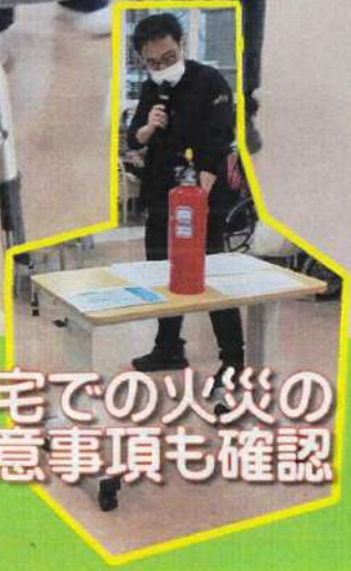
自宅での火災の 注意事項も確認