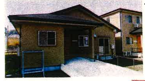
奥に見えるのは、併設の「コージュ金谷」です

定員：22名 対象：要支援・要介護1～5 〒428-0012 静岡県島田市金谷代官町839-8 （国1バイパス高架下、「日切り」バス停側道入り、山本製作所横） TEL.0547-46-5354 FAX.0547-46-5354