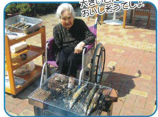
大きいさんまの炭火焼き! おいしそうでしょ