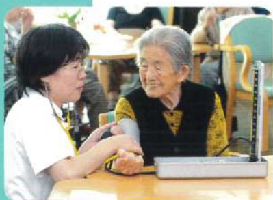
血圧測定 皆さんの健康をチェック します