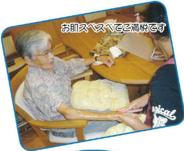
お肌スベスベで喜満悦です