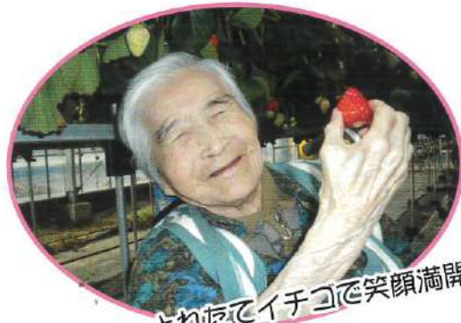
とれたてイチゴで笑顔満開！