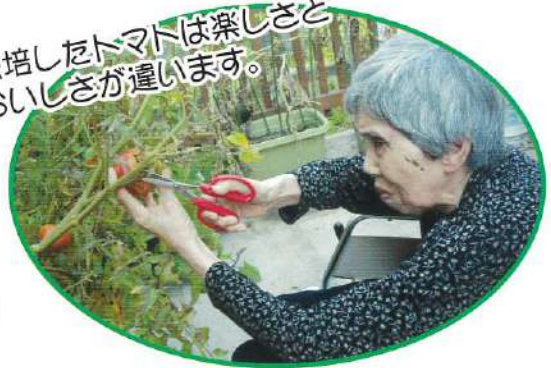
栽培したトマトは楽しさと おいしさが違います。