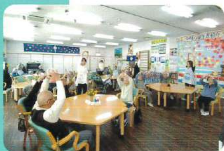
リハビリ体操 みんなで楽しくを モットーに！