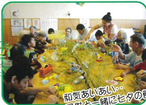
和気あいあい・ 子供と一緒に七夕の飾り付け!