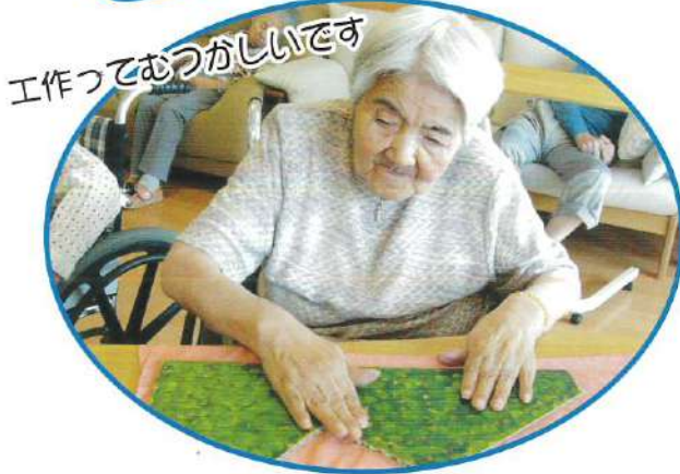
工作つておもしろいです