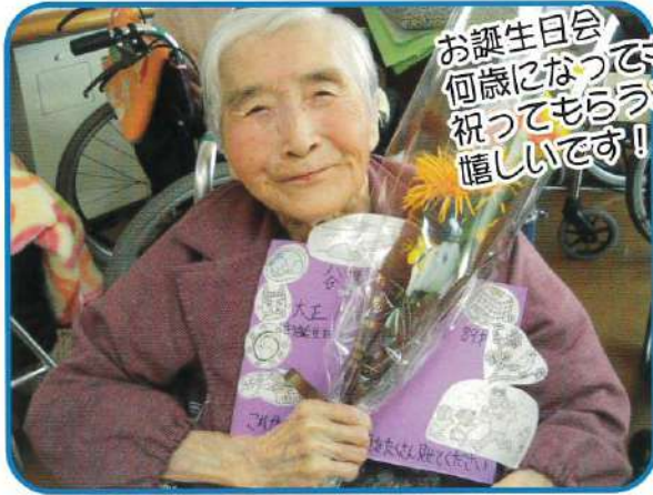
お誕生日会 何歳になっても 祝ってもらうことは 嬉しいです!