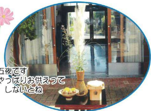
十五夜です やっぱりお供えつて しないとね