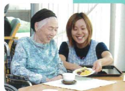
おやつ時間 笑顔がこぼれます…