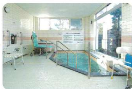
ラジウム温泉にゆっくりと入浴してくだ さい。