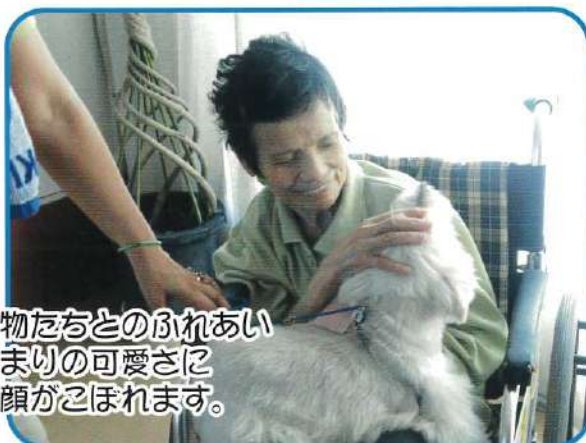
動物たちとのふれあい あまりの可愛さに 笑顔がこぼれます。