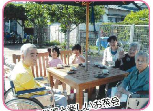
子供達と楽しいお茶会