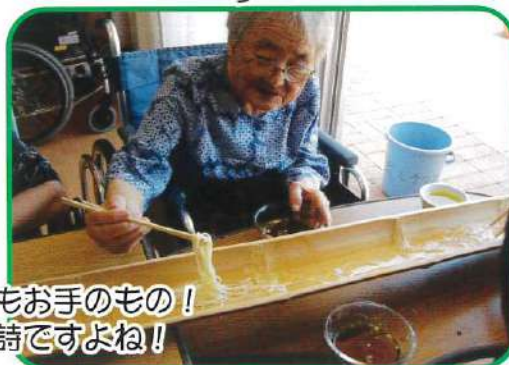
お箸捌きもお手のもの! 夏の風物詩ですよ!