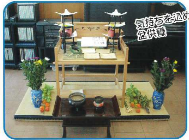
気持ちを込めて 盆供養