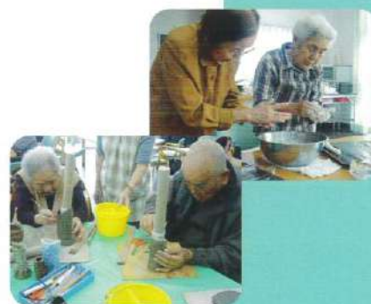
趣味の会（園芸・陶芸 他）