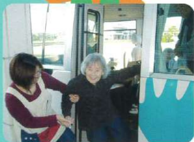
お迎え 今日も一日元気よく！