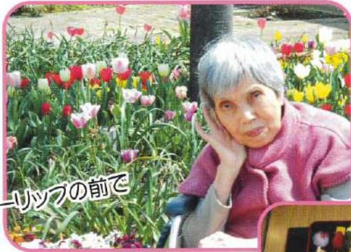
中庭チューリップの前で