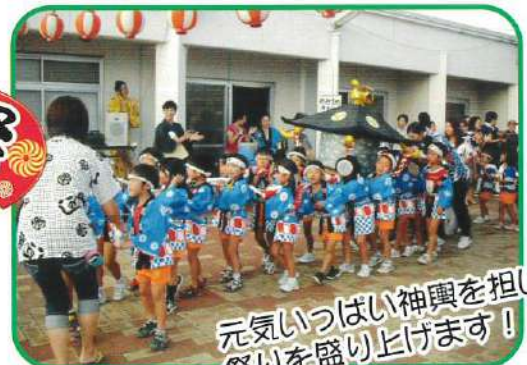
元気いっぱい神輿を担いで 祭りを盛り上げます!