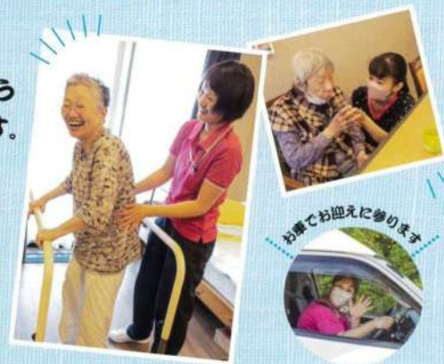
お車で迎えに参ります

通所介護施設「ごんべえ」は、 利用者様のリハビリや趣味の活動を応援します。 利用者様の状態、個々のニーズに合わせて、 メインフロアの他にサブフロアを設け、 「ごんべえ」ならではのサービスを提供いたします。 和の温もりを持つ外観、施設内の落ち着いた空間構成で 笑顔満ち溢れるコミュニティ空間が広がります。