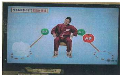
ごぼう先生のレク体操

デイサービス福聚ではエアロバイク、滑車、車いすの方もできる自転車こぎ、平行棒にて昇降歩行や立ち上がり訓練を行い筋力の維持向上を支援しております。日々日常の生活リハビリで自然と体力もついてきます。