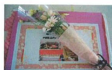
お誕生会（お花とカード）