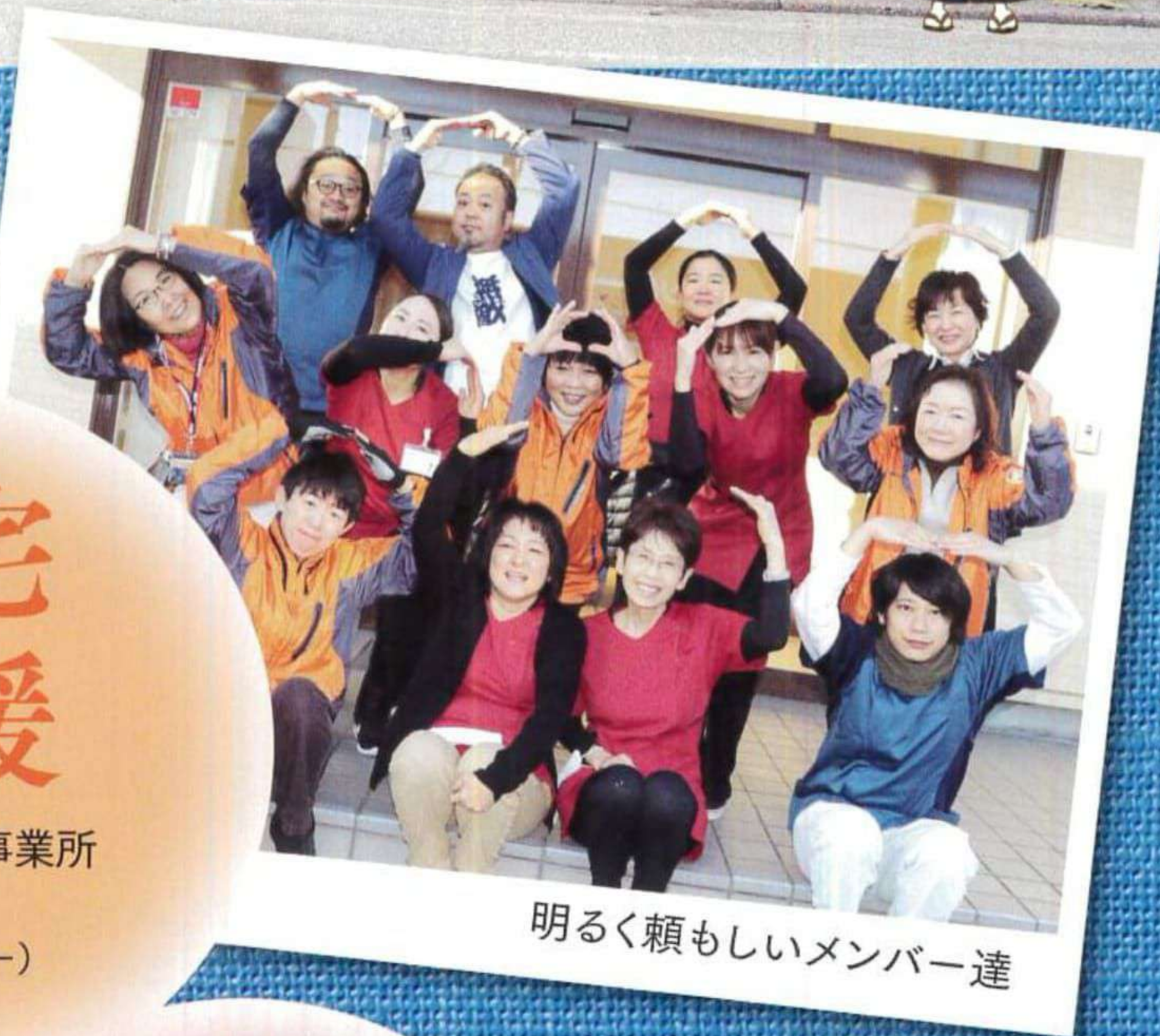
明るく頼もしいメンバー達