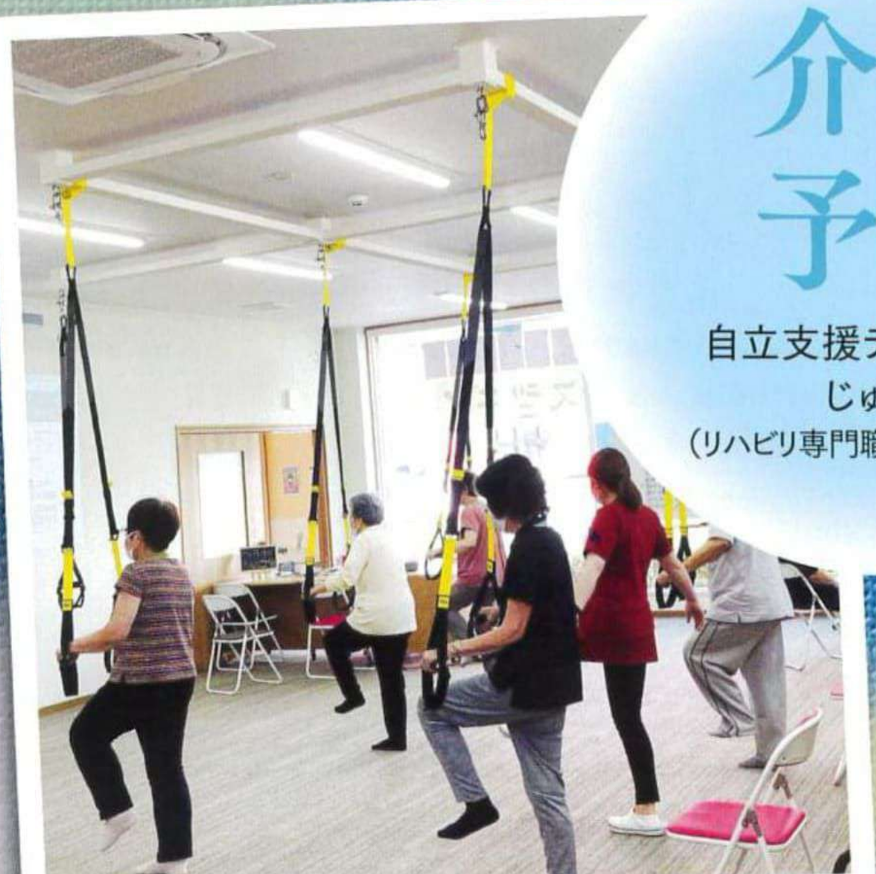
自立支援デイサービスじゅまるメインルーム