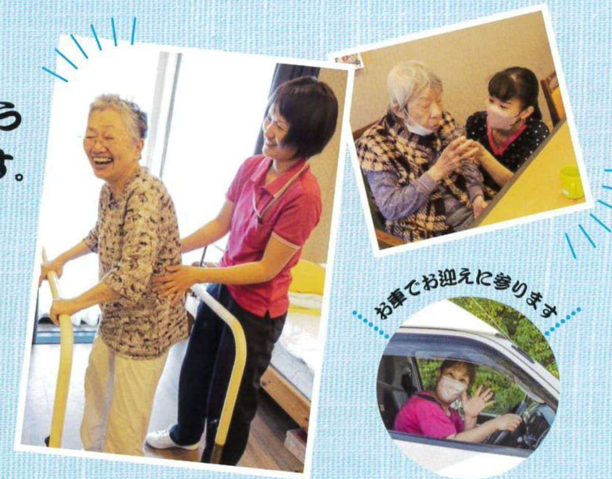
お車で迎えに参ります

通所介護施設「ごんべえ」は、 利用者様のリハビリや趣味の活動を応援します。 利用者様の状態、個々のニーズに合わせ、 メインフロアの他にサブフロアを設け、 「ごんべえ」ならではのサービスを提供いたします。 和の温もりを持つ外観、施設内の落ち着いた空間構成で 笑顔満ち溢れるコミュニティ空間が広がります。