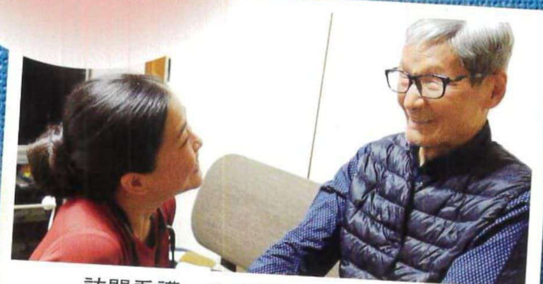
訪問看護・リハビリステーション寿丸