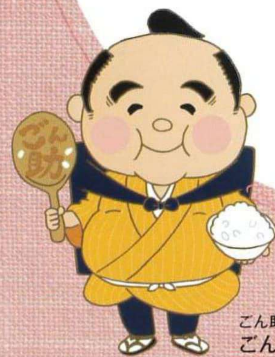
ごん助のイメージキャラクター ごん助さん

あなたに来てくれてよかったと思ってもらえるような 細やかな介護を心がけてご訪問致します。